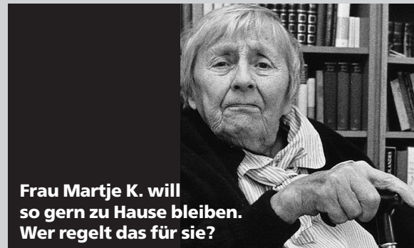
Frau Martje K. will so gern zu Hause bleiben. Wer regelt das für sie?

Der Seminarbeitrag beträgt incl. Beköstigung 15 Euro und wird zu Beginn des Seminars erhoben.